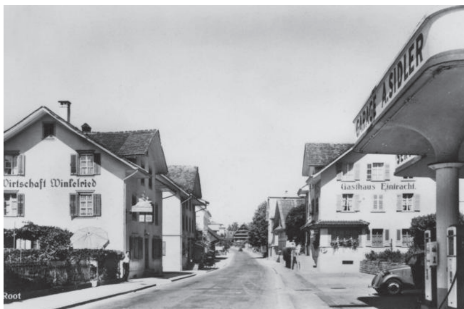
Die Wirtschaft Winkelried in Root (ca. 1940/50)